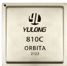
高性能嵌入式AI处理器 Yulong810C

Yulong810C 是欧比特公司推出的新一代嵌入式人工智能系列处理器芯片，芯片聚焦于前端图像处理、前端信号处理和智能控制，芯片具有深度学习、神经网络算法的平台加速能力。Yulong810C 芯片为异构多核架构（CPU+AI 加速器），采用 FD-SOI 生产工艺，具有高性能、高可靠、低功耗的特点，芯片面向智能安防、机器人、AIoT、智能制造、智慧交通等应用场景。